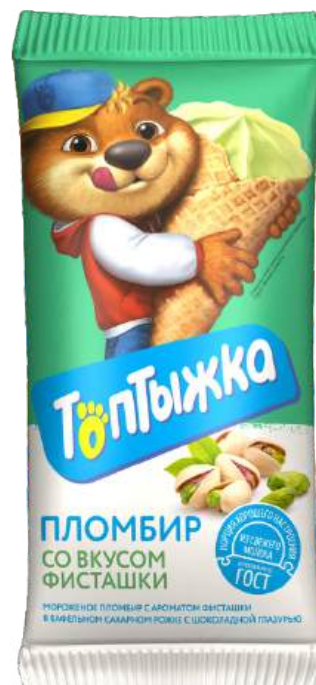
Пломбир «Топтыжка» со вкусом фисташки