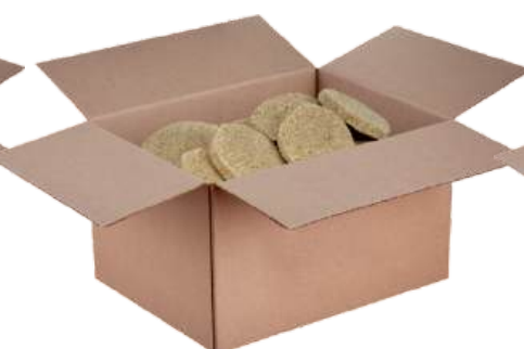
Полуфабрикат замороженный: котлеты куриные «Золотой гребешок»