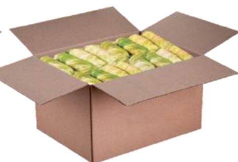
Полуфабрикат замороженный: голубцы