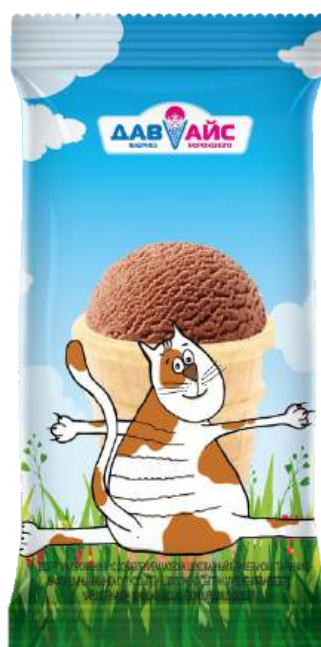
Десерт замороженный «МяуМяу» шоколадный