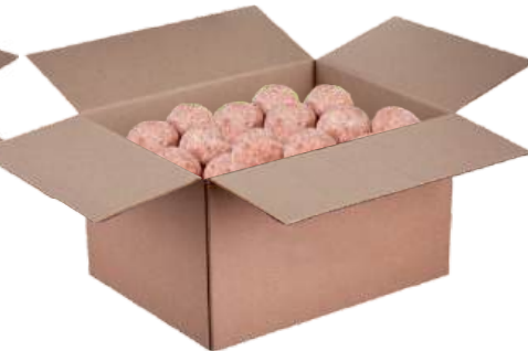
Полуфабрикат замороженный: Ёжики