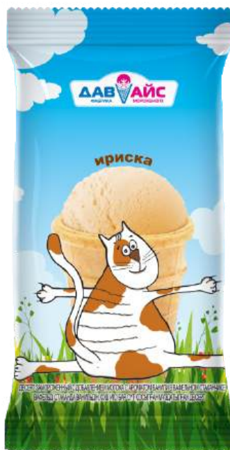
Десерт замороженный «МяуМяу» ириска