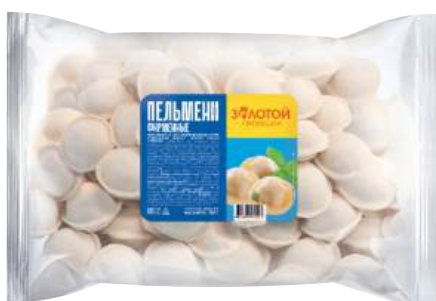
Пельмени Фирменные «Золотой гребешок»