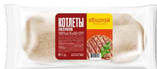
Котлеты Классические «Золотой гребешок»