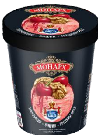
Пломбир «Монарх» вишневый с грецким орехом