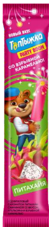
Лёд «Топтыжка» со взрывной карамелью питахайя