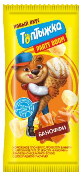
Мороженое «Топтыжка» пломбир с ароматом ванили и со вкусом «Баночки»