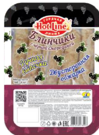
Блинчики с черной смородиной