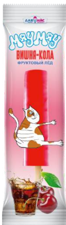
Лёд «МяуМяу» с ароматом «Вишня-кола»