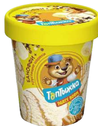
Мороженое «Топтыжка» пломбир ванильный Банюффи с шоколадными шариками