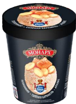
Пломбир «Монарх» карамельный с карамельной начинкой и арахисом