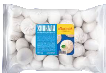
Хинкали «Золотой гребешок»