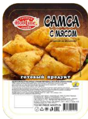
Самса с мясом жареная