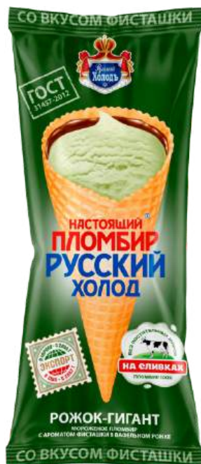
Пломбир «Русский холод» Рожок-гигант фисташковый