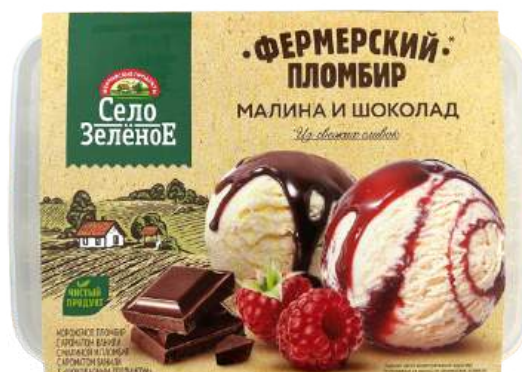
Мороженое «Село Зелёное» пломбир с ароматом ванили с малиной и с шоколадным топпингом