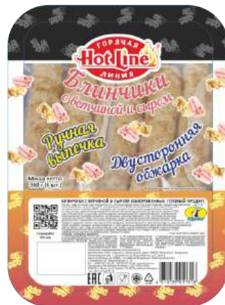
Блинчики с ветчиной и сыром