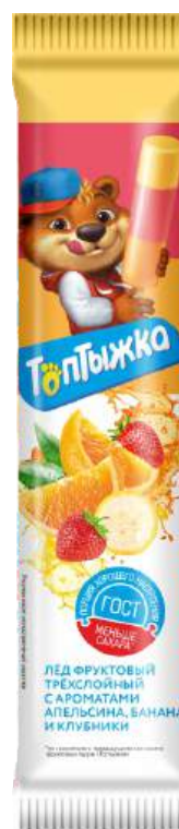
Лёд «Топтыжка» Апельсин, банан, клубника