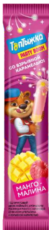
Лёд «Топтыжка» со взрывной карамелью манго-малина