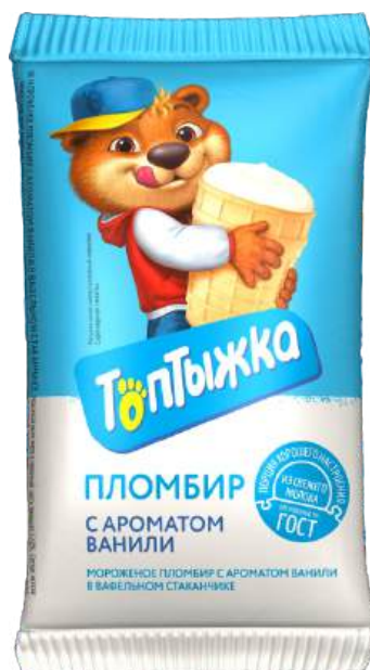
Пломбир «Топтыжка» с ароматом ванили