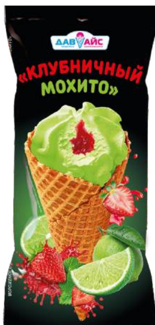
Десерт «Давайс» «Клубничный мохито»