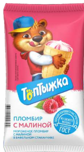
Пломбир «Топтыжка» с малиной