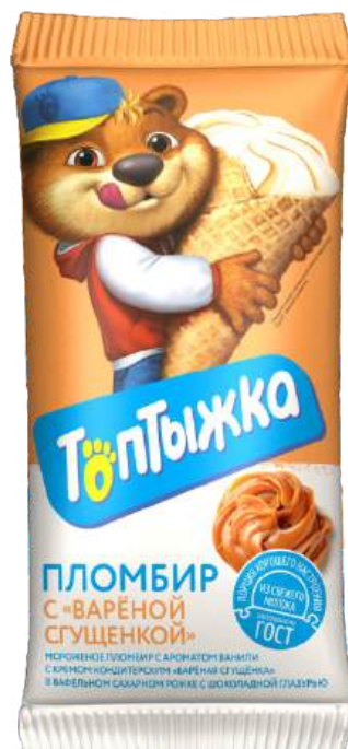
Пломбир «Топтыжка» с варёной сгущенкой