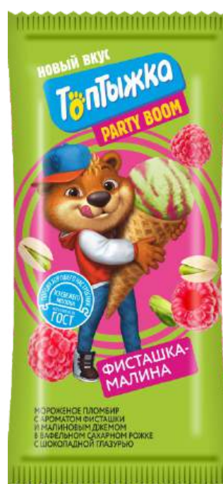
Мороженое «Топтыжка» пломбир с ароматом фисташки и малиновым джемом