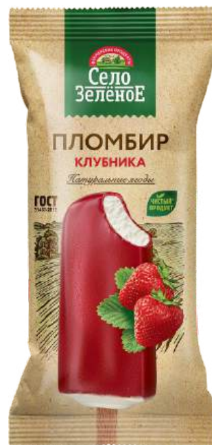
Пломбир «Село Зеленое» в глазури из фруктового пюре «Клубника»