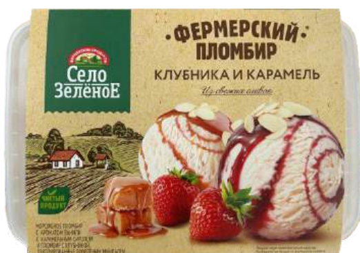
Мороженое «Село Зелёное» пломбир с ароматом ванили с карамельным и клубничным сиропом