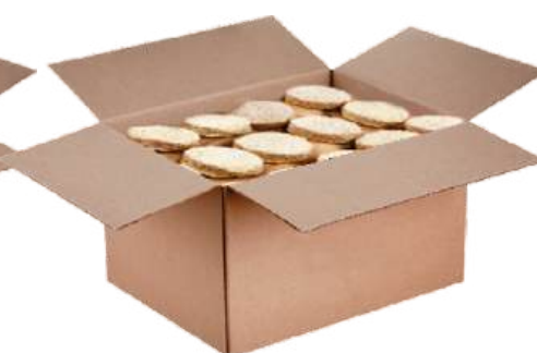
Рыбный полуфабрикат из рыбы тресковых пород: «Котлеты»