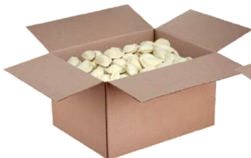
Пельмени с куриным филе, «По-домашнему» из говядины, фирменные «Золотой гребешок»