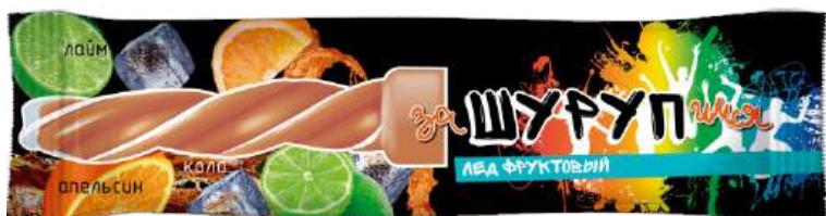
Лёд «Шуруп» «Микс» (лайм, апельсин, кола)