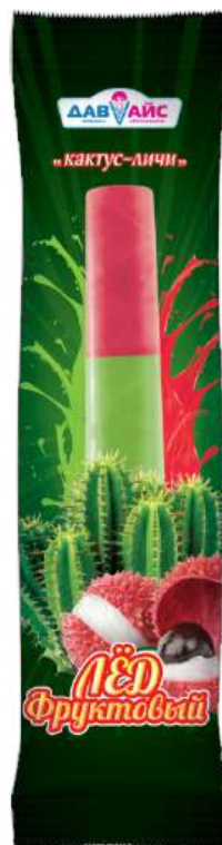
Лёд фруктовый «Давайс» двухслойный «Кактус- Личи»