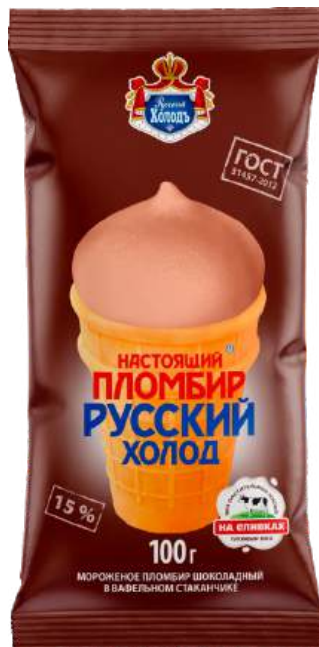
Пломбир «Русский холод» шоколадный