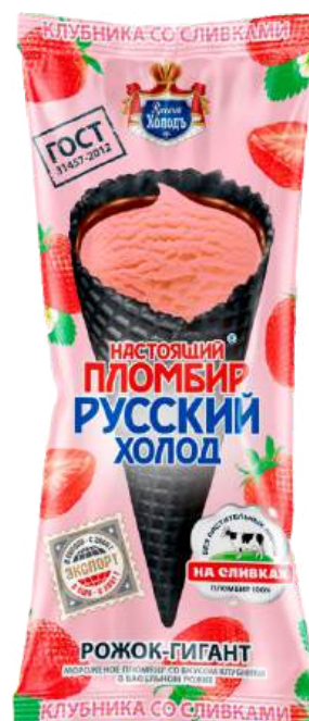
Пломбир «Русский холод» Рожок-гигант «Клубника со сливками»