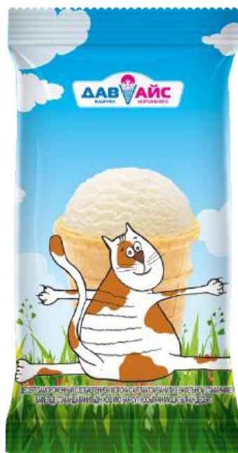
Десерт замороженный «МяуМяу» ванильный