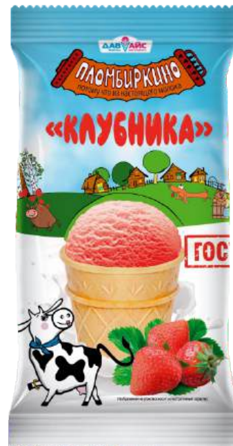
Мороженое «Пломбиркино» молочное, клубничное