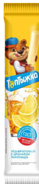
Лёд «Топтыжка» Лимонад