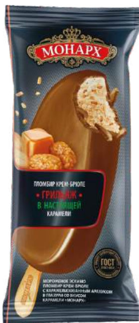
«Монарх» пломбир крем-брюле «Грильяж»