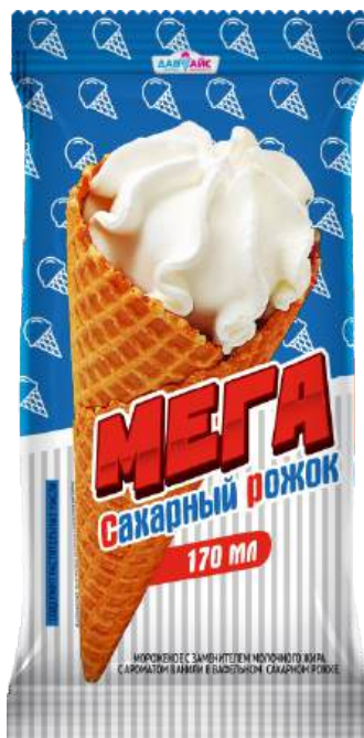
Десерт «Мега сахарный рожок» с ароматом ванили