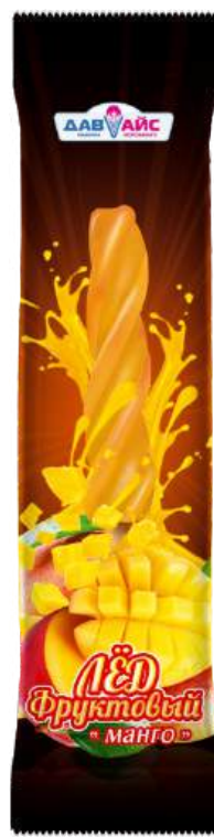
Лёд фруктовый «Давайс» «Манго»