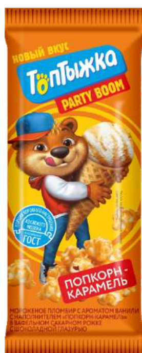
Пломбир «Топтыжка» "Попкорн-карамель"