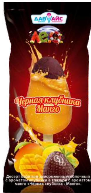
Десерт взбитый замороженный «Черная клубника-манго» В глазури со вкусом манго