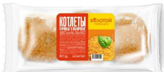
Котлеты куриные в панировке «Золотой гребешок»