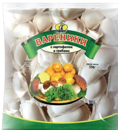
Вареники с картофелем и грибами