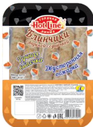
Блинчики с вареной сгущенкой