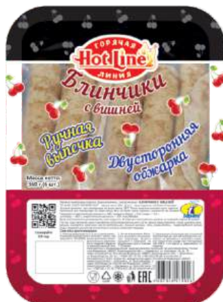
Блинчики с вишней