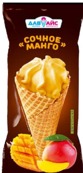
Десерт "Давайс" "Сочное манго"