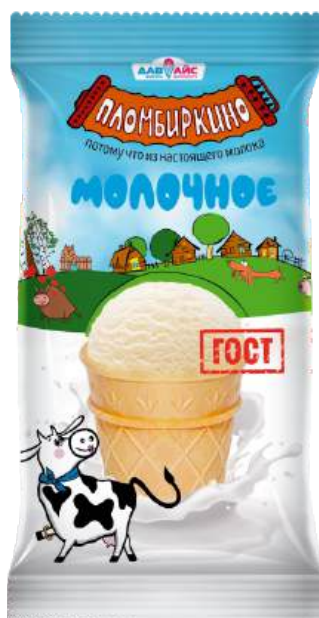
Мороженое «Пломбиркино» молочное, ванильное