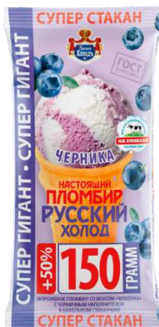
Пломбир «Русский холод» «Черничный чизкейк»