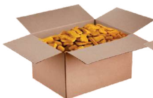
Рыбный полуфабрикат из рыбы тресковых пород: «Наггетсы»