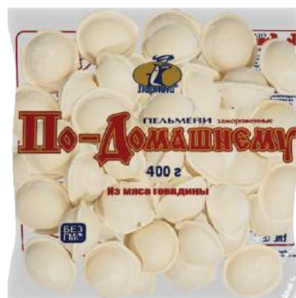
Пельмени "По-Домашнему" из говядины