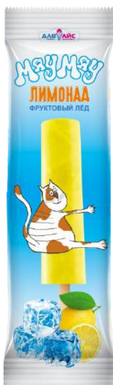
Лёд «МяуМяу» с ароматом «Лимонад»