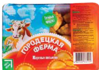
Жареные пельмени «Городецкая ферма»