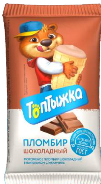
Пломбир «Топтыжка» шоколадный