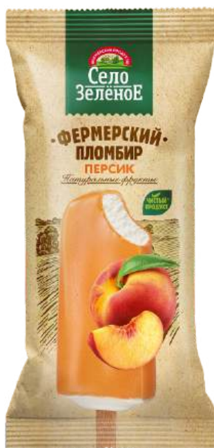
Пломбир «Село Зеленое» в глазури из фруктового пюре «Персик»