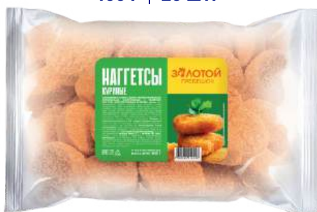
Наггетсы куриные «Золотой гребешок»