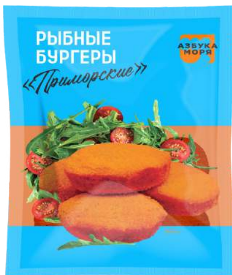
Котлеты рыбные «Бургер Приморский» (минтай)