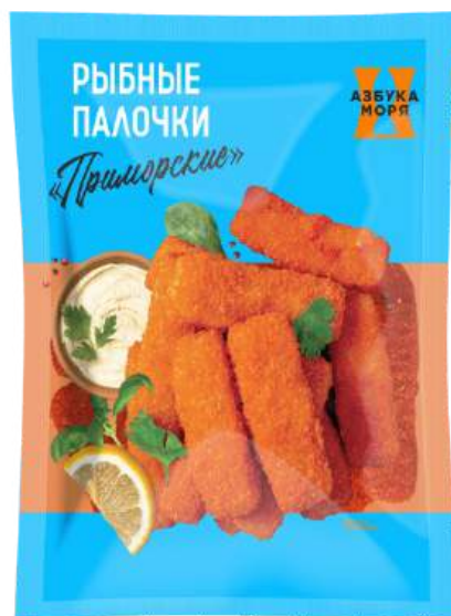
Палочки рыбные «Приморские» (минтай)