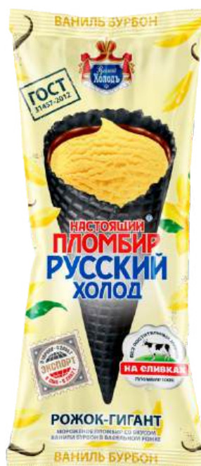
Пломбир «Русский холод» Рожок-гигант «Ваниль бурбон»