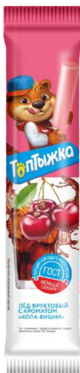
Лёд «Топтыжка» «Кола- вишня»