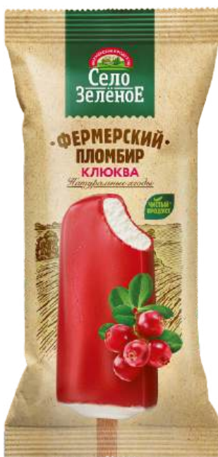
Пломбир «Село Зеленое» в глазури из фруктового пюре «Клюква»