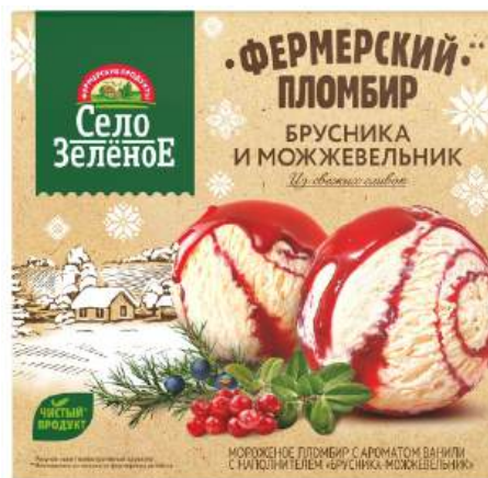
Мороженое «Село Зелёное» пломбир с ароматом ванили с наполнителем «Брусника и можжевельник»