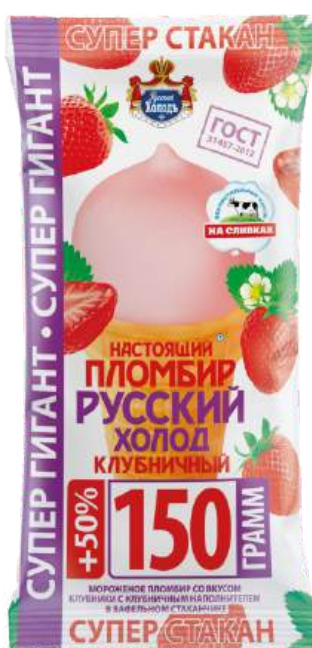
Пломбир «Русский холод» клубничный