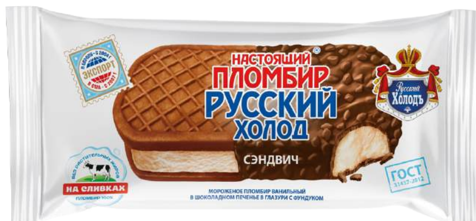
Сэндвич «Настоящий пломбир» в печенье и шоколадной глазури с лесными орехами