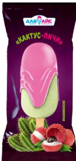
Десерт с ароматом кактуса в глазури «Кактус-Личи»