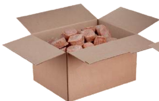
Полуфабрикат замороженный: «Ёжики»