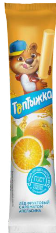
Лёд «Топтыжка» Апельсин