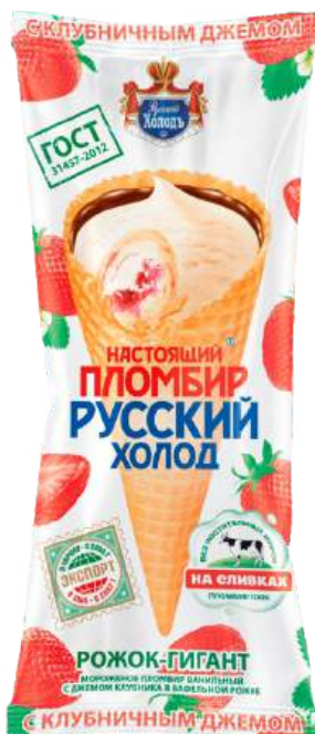
Пломбир «Русский холод» Рожок-гигант с клубничным джемом