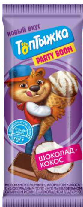
Пломбир «Топтыжка» "Кокос-шоколад"