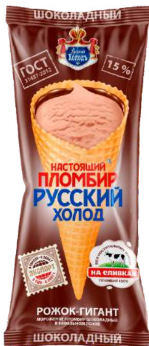
Пломбир «Русский холод» Рожок-гигант шоколадный