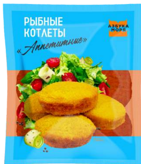
Котлеты рыбные «Аппетитные» (минтай)