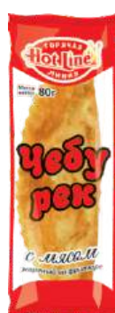
Чебурек с мясом, жареный во фритюре