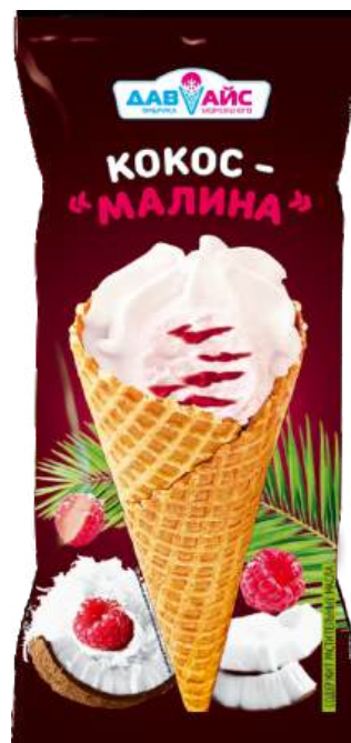
Десерт «Давайс» «Кокос- Малина»