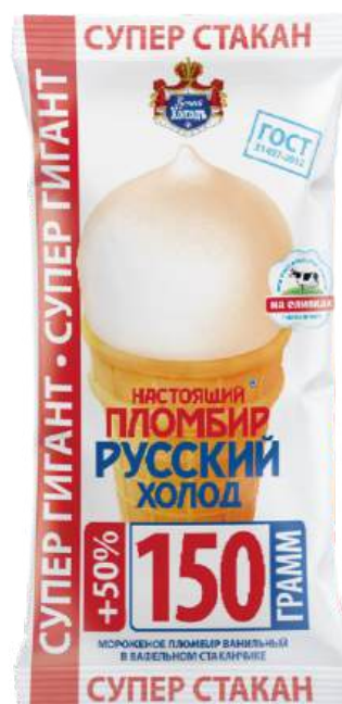
Пломбир «Русский холод» ванильный