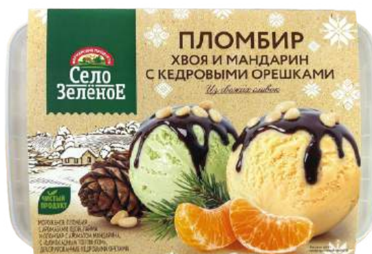
Мороженое «Село Зелёное» пломбир с ароматом хвои, лайма и мандарина