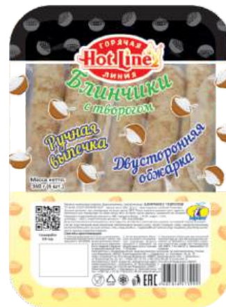
Блинчики с творогом