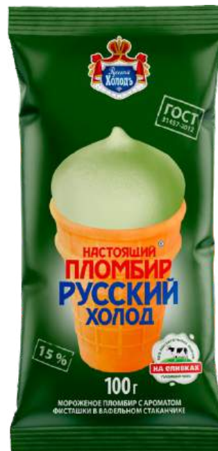
Пломбир «Русский холод» фисташковый