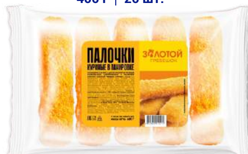
Палочки куриные в панировке «Золотой гребешок»