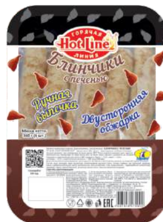
Блинчики с печенью