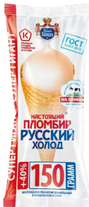
Пломбир «Русский холод» Рожок-гигант ванильный