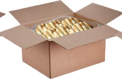
Блины готовые с мясом, ветчиной и сыром, курицей, творогом, вареным сгущенным молоком, клубникой, вишней