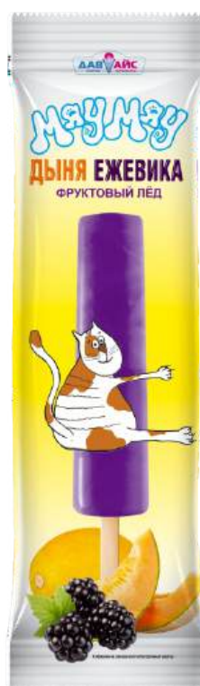
Лёд «Мяу Мяу» фруктовый с ароматом Дыня Ежевика