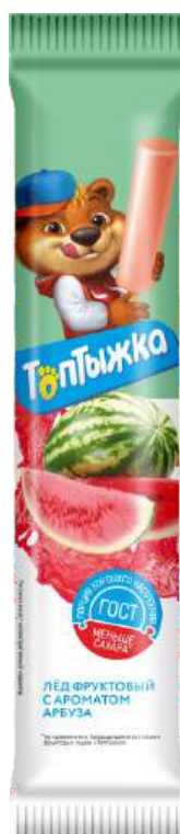
Лёд «Топтыжка» Арбуз