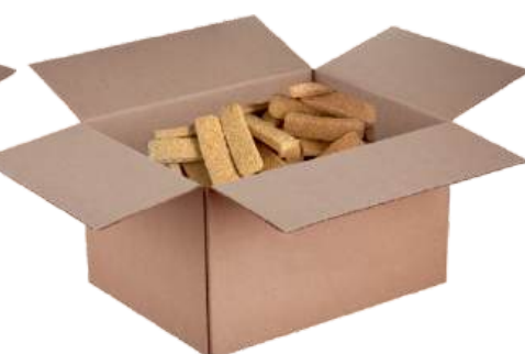
Полуфабрикат замороженный: палочки куриные; наггетсы куриные «Золотой гребешок»