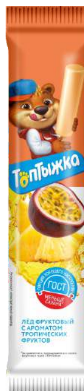
Лёд «Топтыжка» Тропик