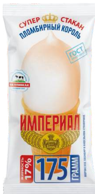
Пломбир «Русский холод» «Империял» Пломбирный король