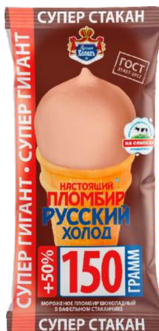
Пломбир «Русский холод» шоколадный