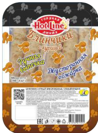
Блинчики с курицей