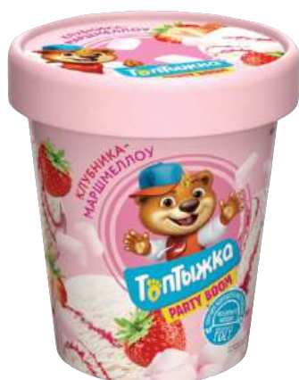
Мороженое «Топтыжка» пломбир с ароматом ванили с воздушным суфле и клубничным-маршмеллоу