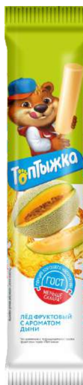
Лёд «Топтыжка» Дыня