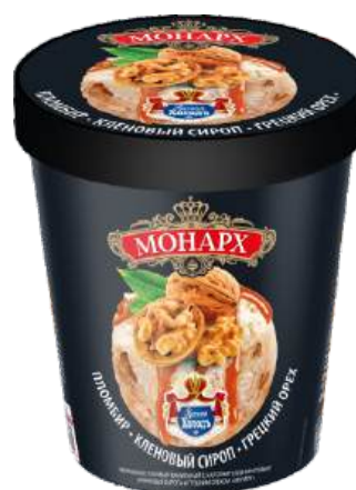
Пломбир «Монарх» ванильный с кленовым сиропом и грецким орехом