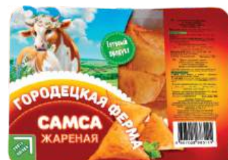
Самса жареная «Городецкая ферма»