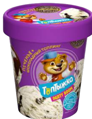
Мороженое «Топтыжка» пломбир ванильный с печеньем и шоколадным топпингом