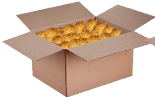
Изделия, жареные во фритюре: чебуреки жаренные с мясом, пельмени «Жарпели», беляши, самса