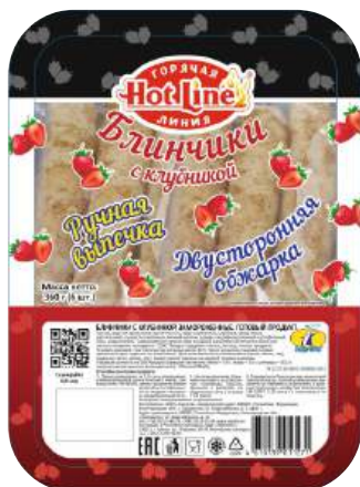
Блинчики с клубникой