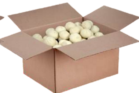
Хинкали «Кавказские», «Золотой гребешок»