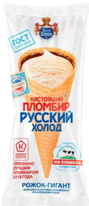
Пломбир «Русский холод» Рожок-гигант ванильный