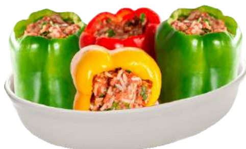
Перец фаршированный с мясной начинкой