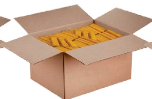
Рыбный полуфабрикат из рыбы тресковых пород: «Палочки»