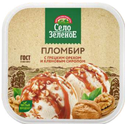
Мороженое «Село Зелёное» пломбир с грецким орехом и кленовым сиропом