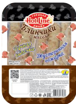
Блинчики с мясом